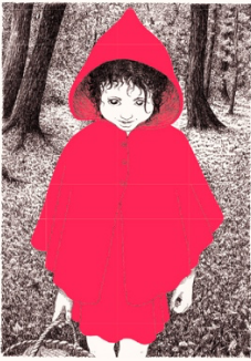
« Bonjour Petit Chaperon rouge »

Demander aux élèves d'écrire ce que pensent et ressentent les deux personnages et en particulier le petit chaperon rouge. Utiliser par exemple la même démarche que l'auteur avec le loup c'est-à-dire en utilisant des phrases très courtes avec des verbes à l'infinitif.