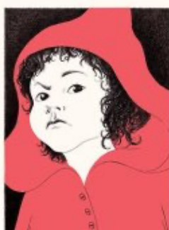
« Attention, le loup est près... »