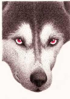
« Bonjour, le loup »