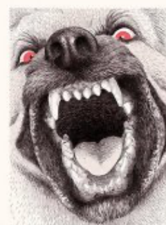
« Au secours ! »

Oral : Après analyse, proposer une lecture expressive à deux voix de cet album.