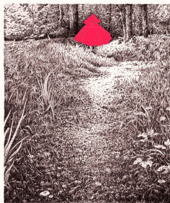
S'éloigner des hommes. Ne pas perdre sa trace.

Les illustrations, presque pleine page, en gravures noires et blanches, sont complétées par un texte minimaliste qui apparaît comme une légende. Et pour aider à la fluidité de la lecture, l'auteur a mis en noir les pensées du loup et en rouge les paroles du petit chaperon :